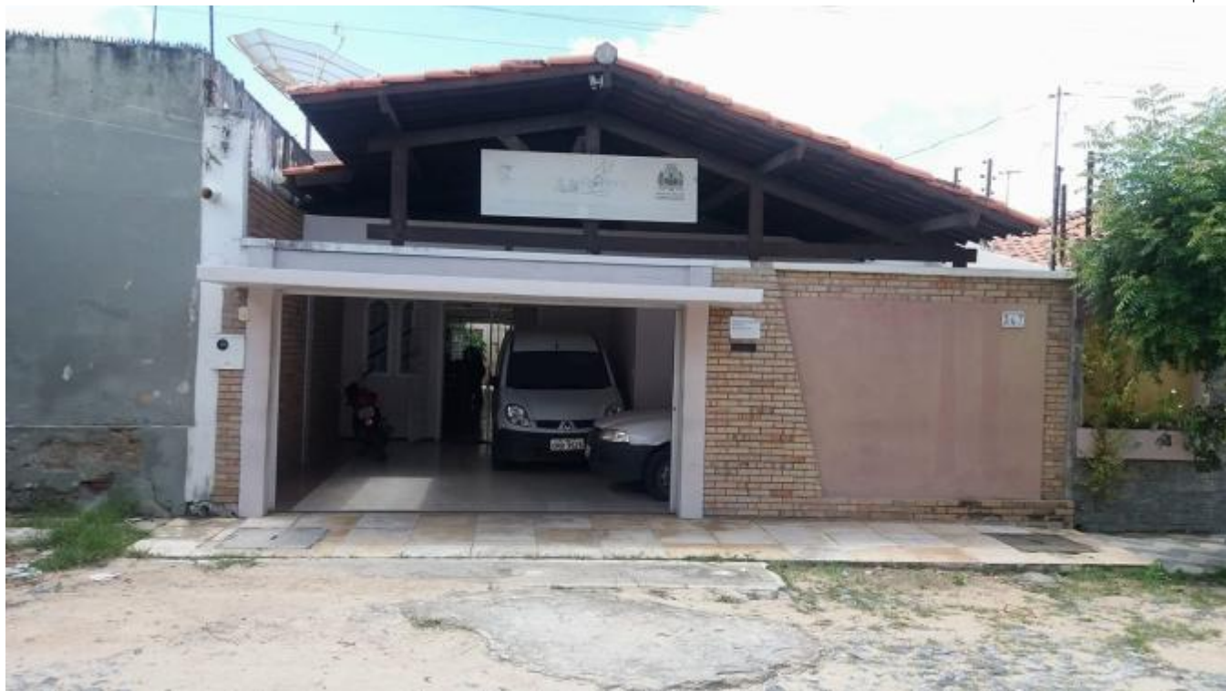
IMAGEM 2 SOBRAL - Placa entre as ruas Dr. Raimundo Lima Neto (CEP 32030 501) e Av. Arlindo Vieira de Almeida ( CEP 62030 490).